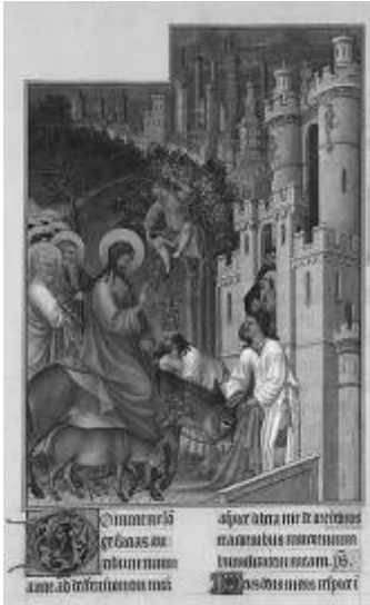
Der Einzug Jesu in Jerusalem am Palmsonntag . Darstellung aus dem Stundenbuch des Herzogs von Berry .

Alle vier Evangelisten des Neuen Testaments berichten über die Passion Jesu, sein Leiden und Sterben - vom Jubel beim Einzug bis zum „Kreuzige ihn“ und seinem Tod am Kreuz. Diesen Zeitraum bezeichnet man als Karwoche, die –stille-Woche vor Ostern. Sie ist die Kernzeit der österlichen Passionszeit und für Christen die wichtigste Woche des Kirchenjahres. Sie hat in allen christlichen Konfessionen für den christlichen Glauben die zentrale Bedeutung, weil sie dem Gedächtnis des Leidens, Sterbens und der Auferstehung Christi gewidmet ist. „ Kar “ stammt vom althochdeutschen Wort „kara“ und bedeutet Kummer, Wehklage oder Trauer. Die Karwoche beginnt mit Palmsonntag , dem Gedenktages des Einzugs Jesu in Jerusalem. Für die Bevölkerung war er der Messias. Mit Jubel wurde er empfangen, Palmzweige wurden auf der Straße ausgebreitet. Sie riefen „Hosanna dem Sohn Davids“.